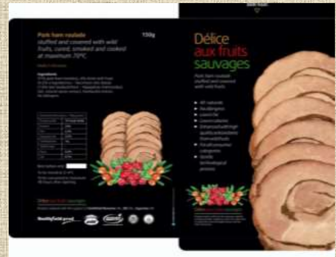
AMBALAJ PRODUS FELIAT